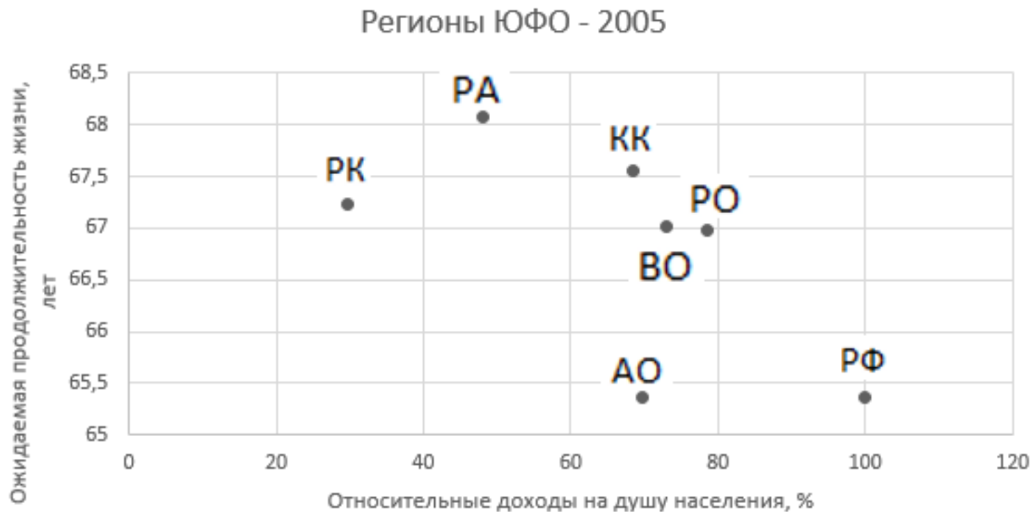
Рисунок 2 – Регионы ЮФО в пространстве «уровень жизни – качество жизни» в 2005 г. (РК – Республика Калмыкия, РА – Республика Адыгея, КК – Краснодарский край, РО – Ростовская область, ВО – Волгоградская область, АО – Астраханская область, РФ – Российская Федерация)