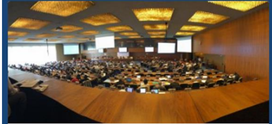
Panoramic of the #ICLS20